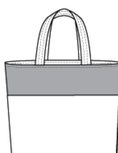
C 16"W x 17"L (41cm x 43cm)