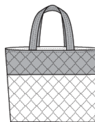
D 16"W x 17"L (41cm x 43cm)

BUTTERICK PATTERN, 120 BROADWAY, NEW YORK 10271 © 2012 The McCall Pattern Co. ● www.butterick.com